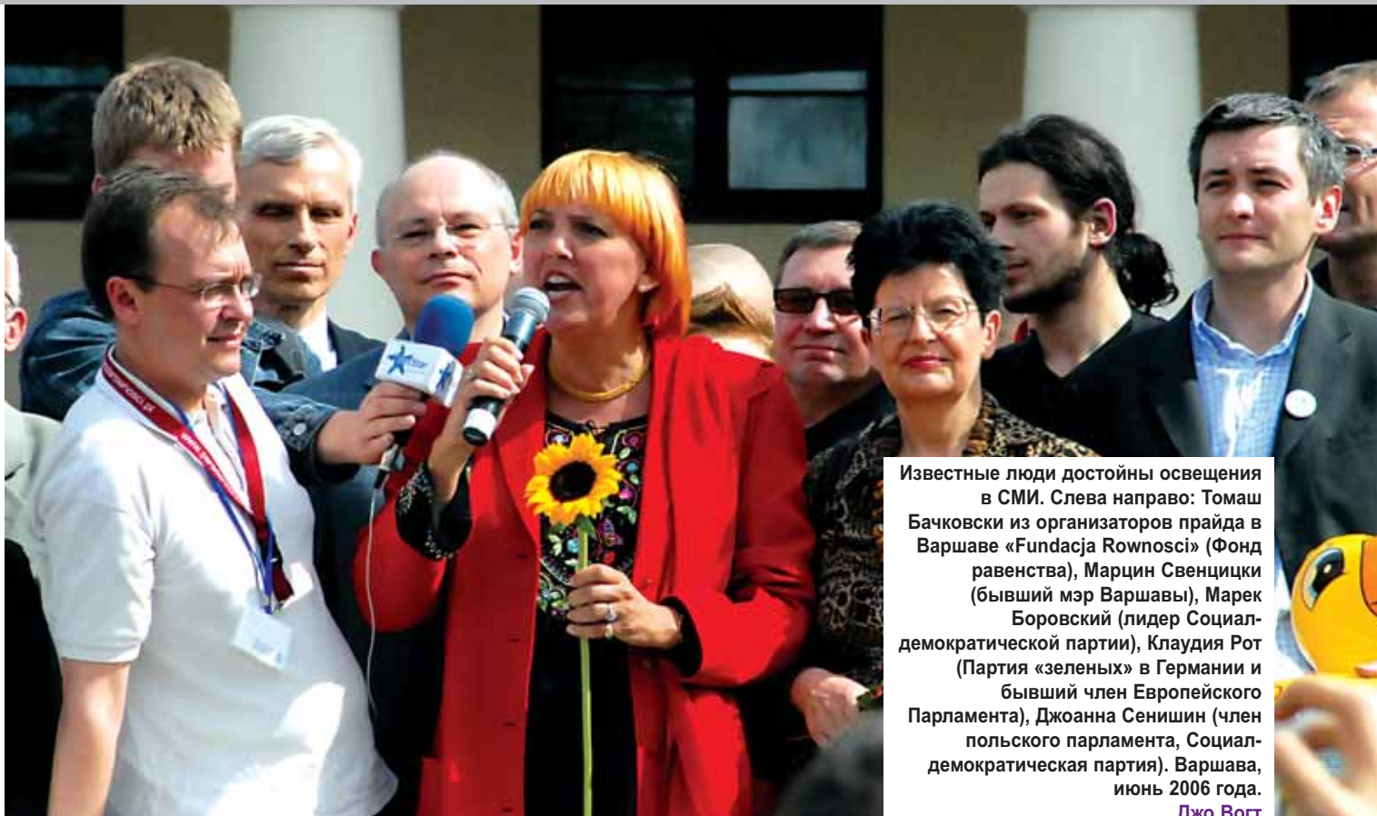
Известные люди достойны освещения в СМИ. Слева направо: Томаш Бачковски из организаторов прайда в Варшаве «Fundacja Rownosci» (Фонд равенства), Марцин Свенцицки (бывший мэр Варшавы), Марек Боровский (лидер Социал-демократической партии), Клаудия Рот (Партия «зеленых» в Германии и бывший член Европейского Парламента), Джоанна Сенишин (член польского парламента, Социал-демократическая партия). Варшава, июнь 2006 года.