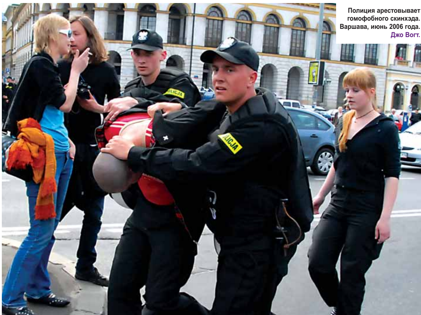
Полиция арестовывает гомофобного скинхэда. Варшава, июнь 2006 года. Джо Вогт.

● Подумайте, следует ли детям участвовать в прайде – это вопрос безопасности и связи с общественностью.