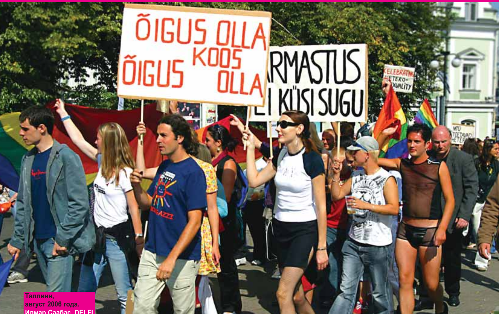
Таллинн, август 2006 года.