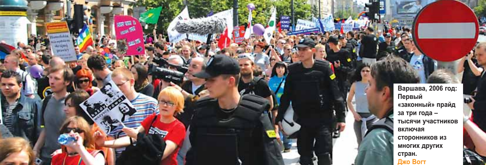
Варшава, 2006 год: Первый «законный» прайд за три года – тысячи участников включая сторонников из многих других стран. Джо Вогт

В 2005 году, являясь участником «EuroPride» в Осло, группа «Skeiv solidaritet» (гей-солидарность) выпустила календарь («Se min kjole» - «Посмотри, во что я одет») с фотографиями знаменитого гетеросексуального норвежца, одетого в женскую одежду. В результате продажи календаря была собрана сумма в 180.000 норвежских крон (22.620 евро) в поддержку двух организаций Восточной Европы: «Круг» в Мурманске, Россия, и «ГендерДок-М» в Кишиневе, Молдова.