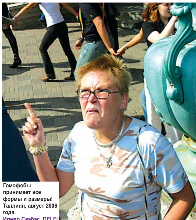
Гомофобы принимает все формы и размеры! Таллинн, август 2006 года.