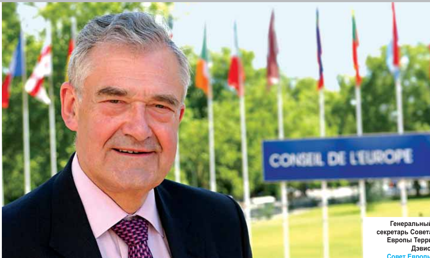
Генеральный секретарь Совета Европы Терри Дэвис.

«На кону защита основных прав человека» (см. приложение 2, 1.2.2, ссылка на полный текст речи)