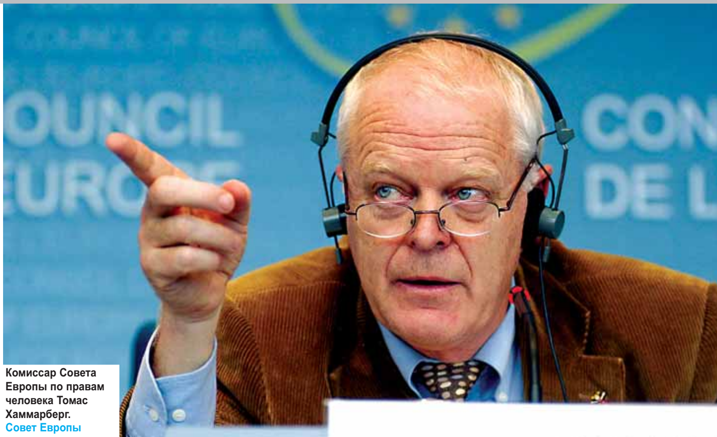
Комиссар Совета Европы по правам человека Томас Хаммарберг. Совет Европы

«Право на свободу собрания принадлежит всем людям» (см. приложение 2, 1.2.5, ссылка на полный текст речи)