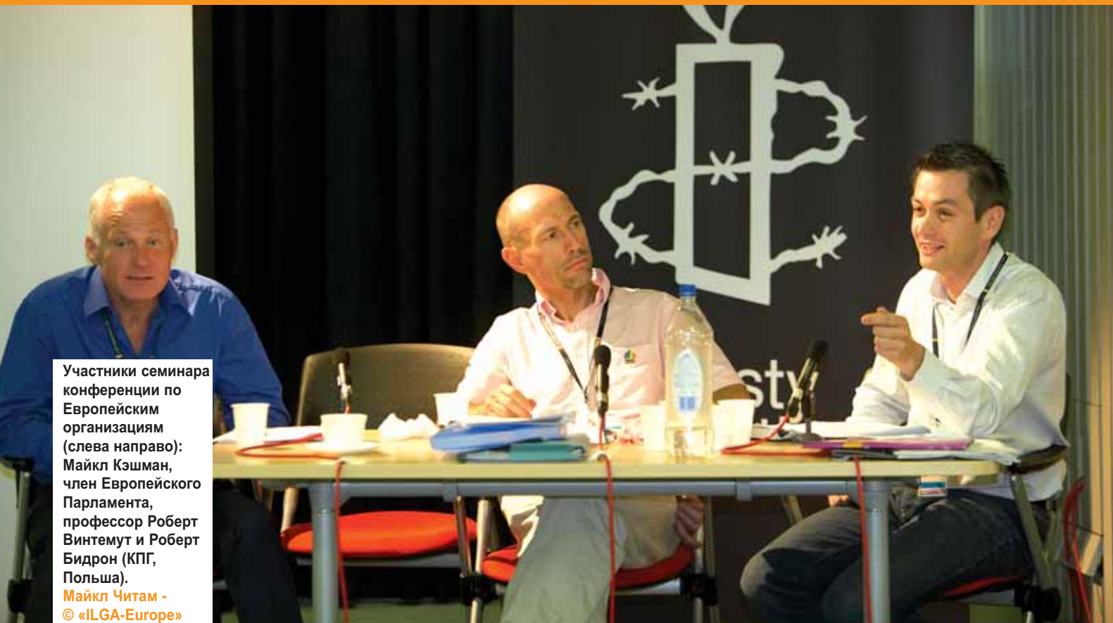
Участники семинара конференции по Европейским организациям (слева направо): Майкл Кэшман, член Европейского Парламента, профессор Роберт Винтемут и Роберт Бидрон (КПГ, Польша).