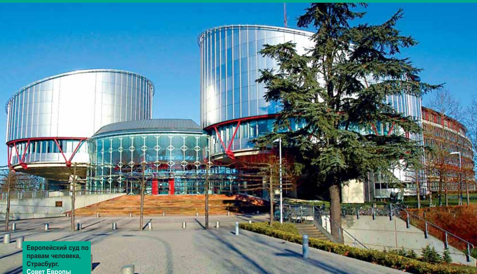
Европейский суд по правам человека, Страсбург. Совет Европы

«Каждый имеет право на свободу мирных собраний» (Европейская конвенция по правам человека – Статья 11)